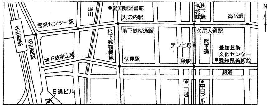
愛知県美術館ギャラリー関係案内図（1F）